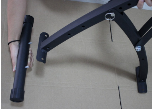
Fixez la base