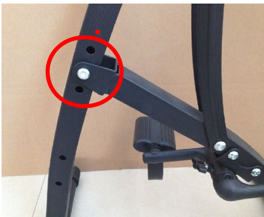
A. utiliser la vis pour fixer la pédale