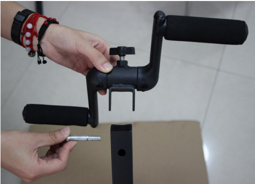
Installez la barre à main