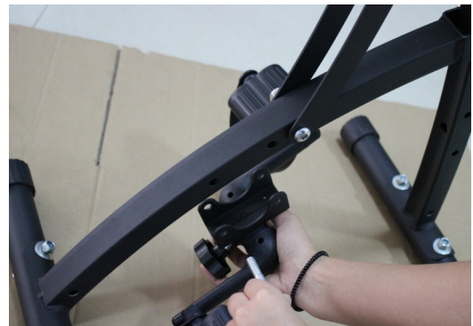
Installez la pédale