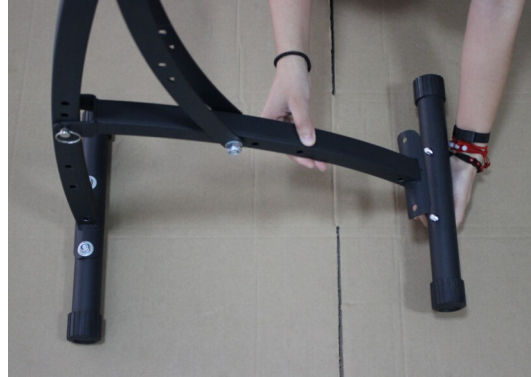
Fixez la base